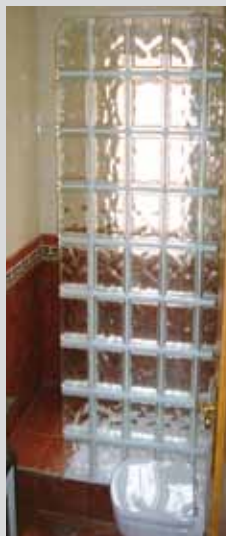
Alicatados y solados