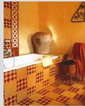
Proyectos de decoración