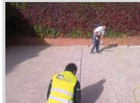
Impermeabilización y solados